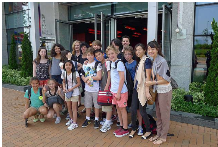
PHPS 交流團由本校老師帶領到香港展城館參觀