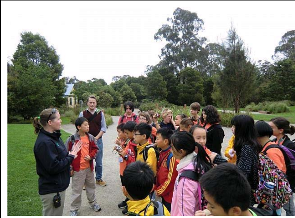
本校學生到訪澳洲 Princes Hill Primary School