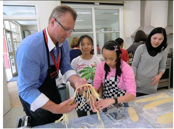
本校學生到訪澳洲 Princes Hill Primary School 並參與課堂活動