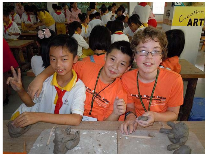
PHPS 交流團及本校接待生一同參與羅村實驗小學的陶藝課。