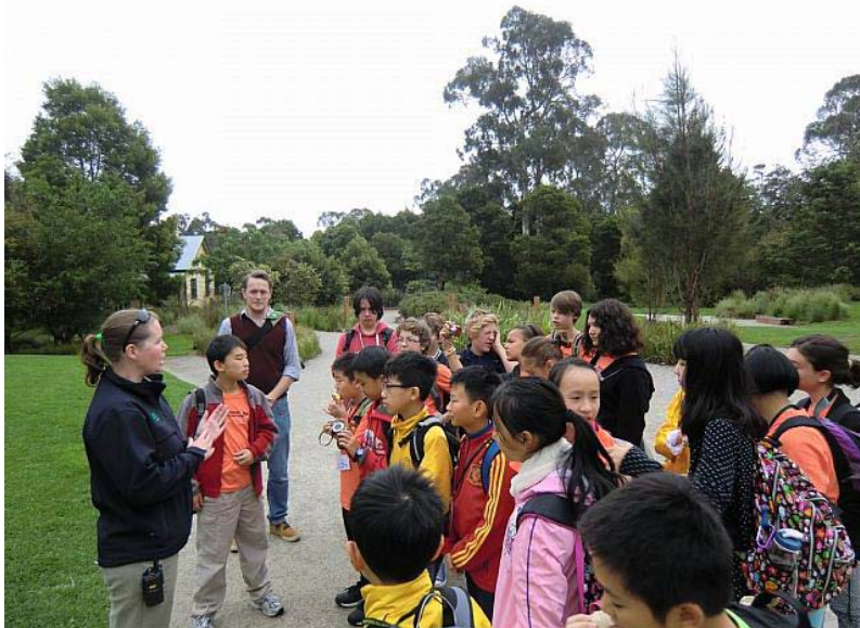
本校交流團到 Healesville Sanctuary 參觀

除此以外，PHPS 亦為本校交流團安排了不同性質的交流活動：學術方面，該校安排本校交流生參與五、六年級的課堂活動、意大利文課、戶外學習活動(參觀 Healesville Sanctuary 及墨爾本博物館)等；而文化方面則安排他們參與澳式烹飪課、視像會議等。至於老師方面，除安排本校老師進班觀課及舉行兩校老師交流課程發展的會議外，本校老師亦獲邀請為該校學生主持一節普通話課。