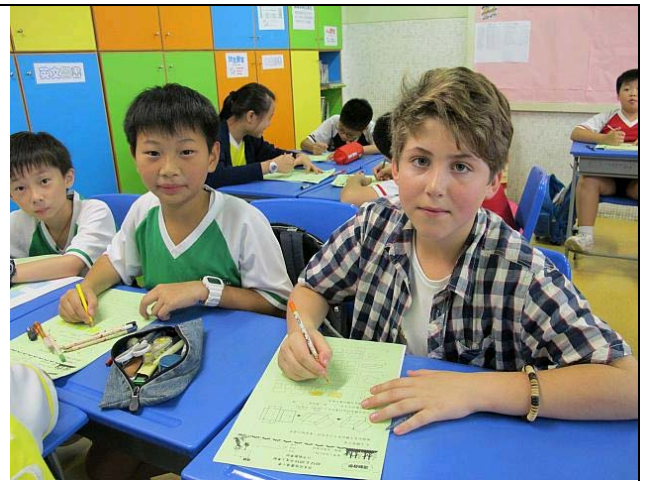
澳洲 Princes Hill Primary School 學生訪校並進班上課