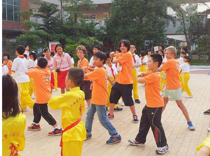
PHPS 交流團及本校接待生一同到南海羅村實驗小學進行交流，圖為功課堂的上課情況。