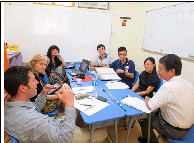
Princes Hill Primary School 校長及老師與本校陳校長及數學科師交流兩校數學課程