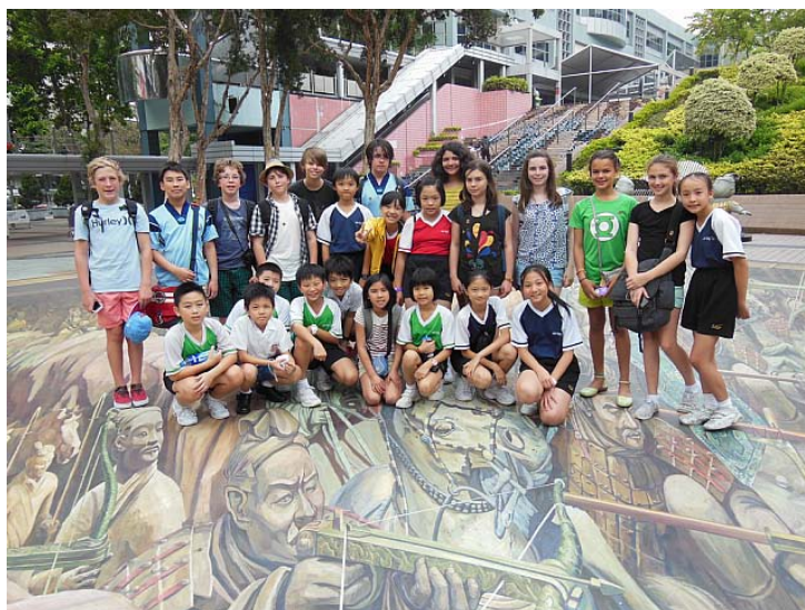
PHPS 交流團及本校接待生由本校老師帶領到香港歷史博物館參觀