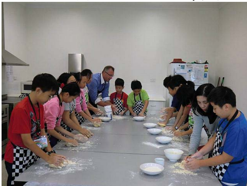
本校交流團參與澳式烹飪課，學習製作拉明頓蛋糕。