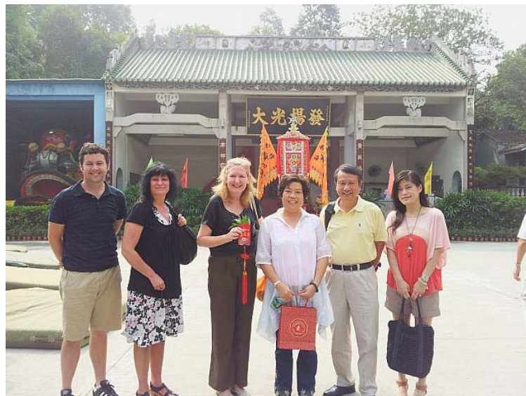
PHPS 交流團及本校交流團由羅村實驗小學校長和老師帶領到西樵山觀光。