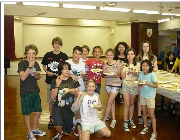
澳洲 Princes Hill Primary School 學生訪校並參與烹飪課