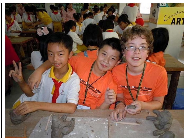
本校及澳洲 Princes Hill Primary School 訪問南海羅村實驗小學，中港澳三地三校學生共同上課