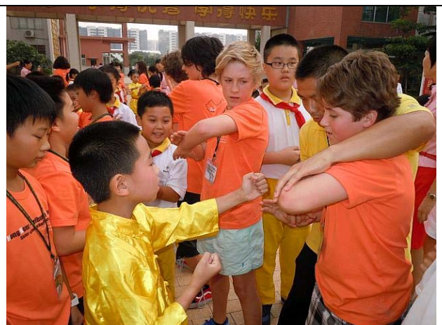
本校及澳洲 Princes Hill Primary School 訪問南海羅村實驗小學，進行中港澳三地三校師生交流