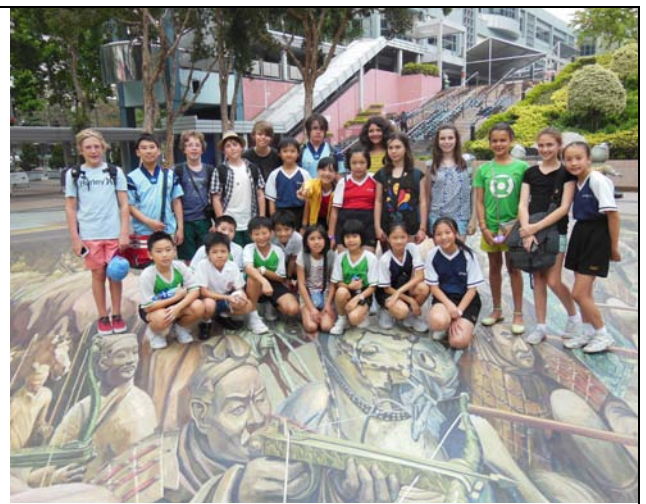
澳洲 Princes Hill Primary School 學生訪校並與本校結對學生參觀香港歷史博物館