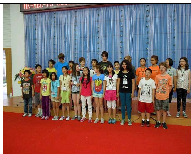
本校及澳洲 Princes Hill Primary School 訪問南海羅村實驗小學，兩校學生表演合唱